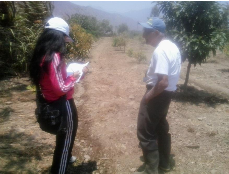
Encuestando a Beneficiario.