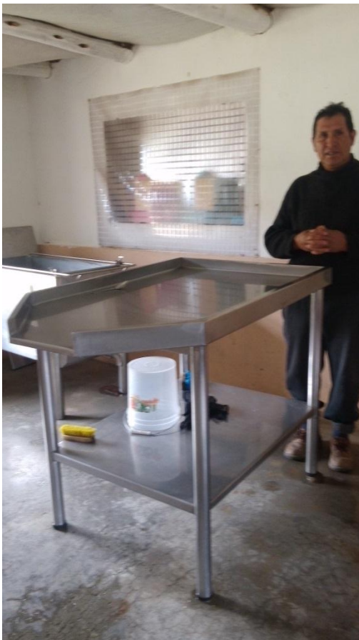
Beneficiario y conductor de centro de producción de derivados lácteos