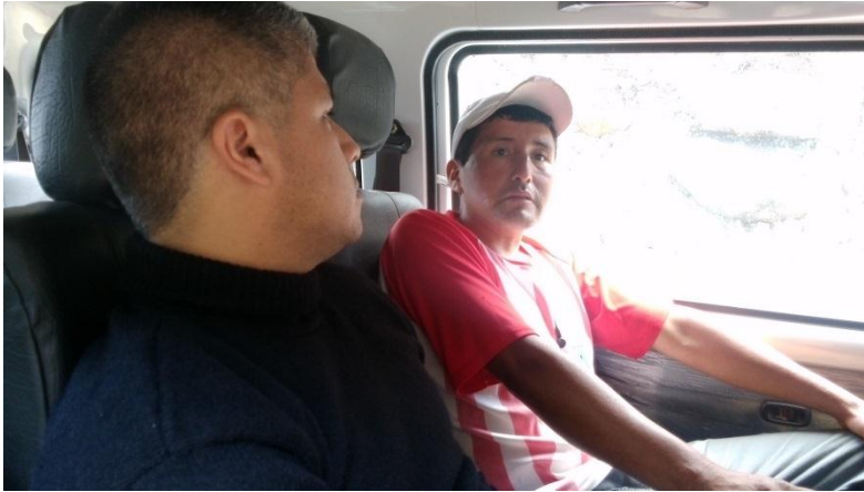
Entrevista con beneficiario productor de palta