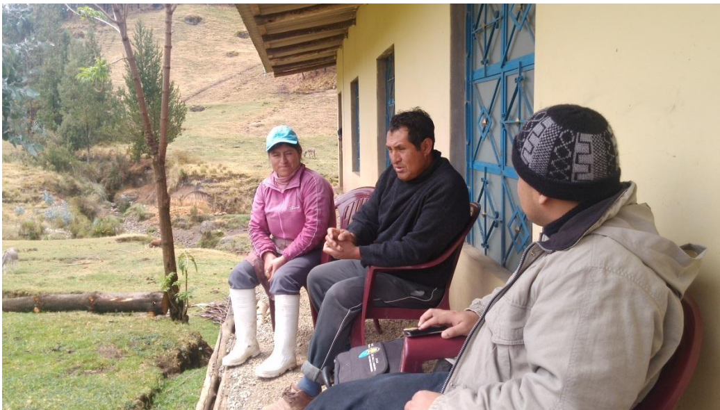
Entrevista en Centro de Producción de derivados lácteos