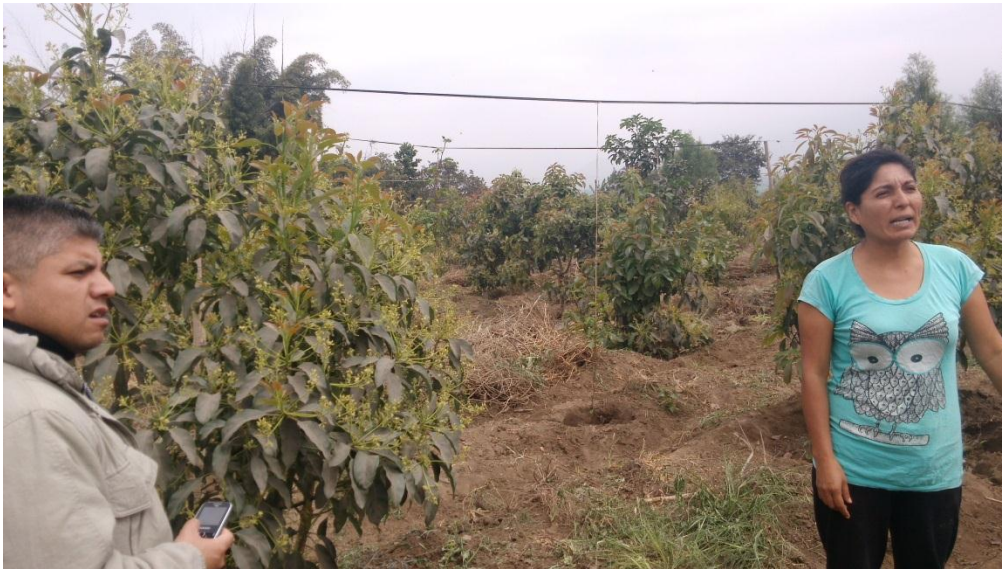
Entrevista con productora de palta y Presidenta de Asociación de Productores.