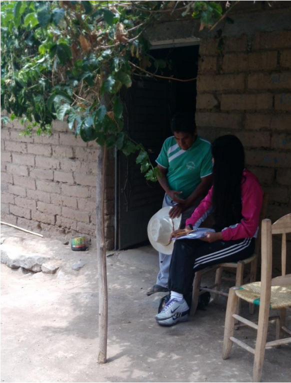
Encuestando a Beneficiario.